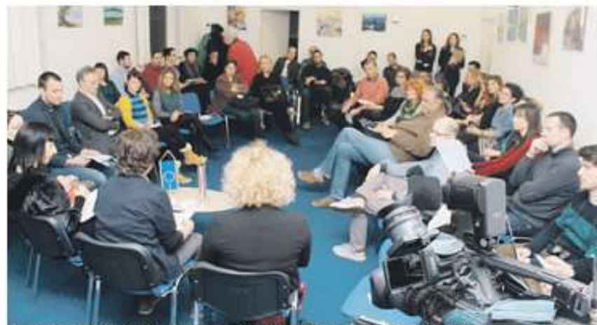
Tema je izazvala veliko zanimanje, prije svega mladih, posebno vezano za Centar za mlade